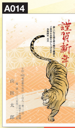
添え書き変更不可