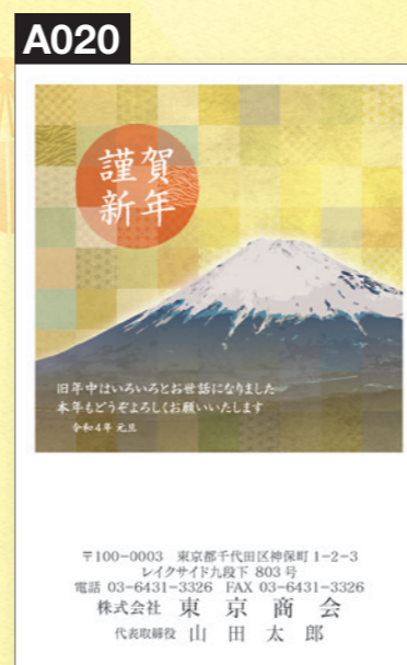
添え書き変更不可