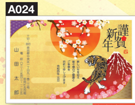
添え書き変更不可